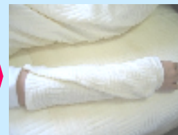
【冷却タオルでクーリング】