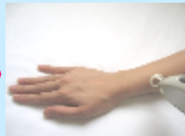
【テスト照射・ドクターチェック】