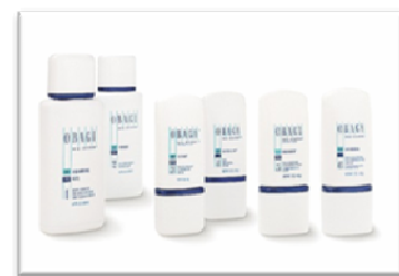
【これがオバジニューダームシステムです】

10月から「オバジニューダームシステム」がスタートします！！オバジはドラッグストアで販売されているロート製薬さんのものではなく、医療機関でしか販売されていないもので、お肌のトラブル(シミ、しわ、にきび、たるみ等)を改善してしまうドクターズコスメです。使用期間中はお肌が赤くなったり、悪い角質が剥がれてポロポロなったりというデメリットはありますが、その分効果が非常に優れており、1クール続けていただくと、今までとは全く違ったお肌に生まれ変わらせることができます。料金は74,340円(7回の診察代込です)。ご興味がおありの方はまず、10月開催されるセミナーにご参加ください。本当に画期的な商品なんですよ。