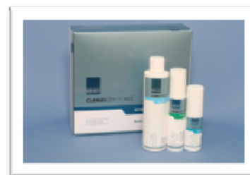
【オバジクレンジーム】

自由診療部では、難治性のニキビに効果のあるドクターズコスメ、「オバジクレンジーム」を使った治療を開始します。オバジクレンジームとは、ニキビの原因に深く効く「可溶性過酸化ベンゾイル(BPO)」を配合した強力な医療機関専売ニキビ治療薬です。「抗菌作用」「皮脂詰まりを溶解する作用」があり、アクネ菌を殺菌することで、ニキビを根本から治療します。肌を乾燥させることなく、現在あるニキビを改善し、ニキビができにくい肌に整えます。思春期ニキビから大人ニキビまで、あらゆるニキビに素早く、強力に働きかけます。ご興味おありの方はお気軽にお問い合わせください。料金は24,150円になります(診察料込みの値段となっています)。