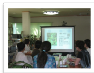
【楽しく漢方のお勉強をしました】