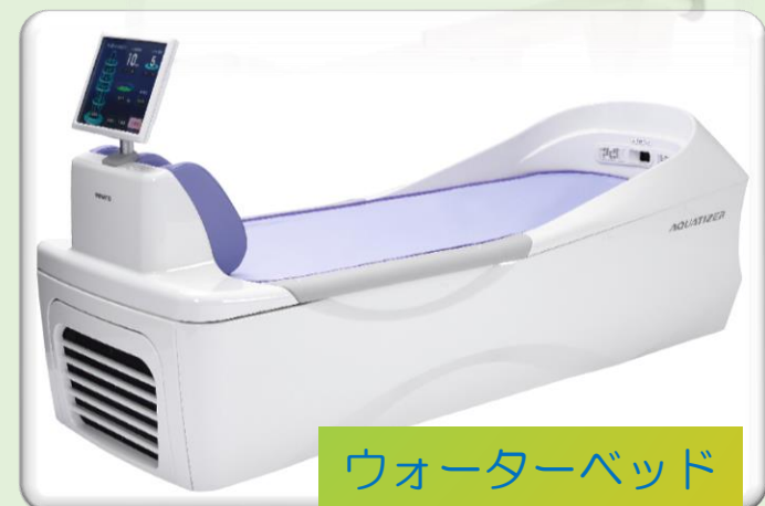
ウォーターベッド